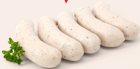
Weisswürstli mit 2 Senf gratis 5 x 60g