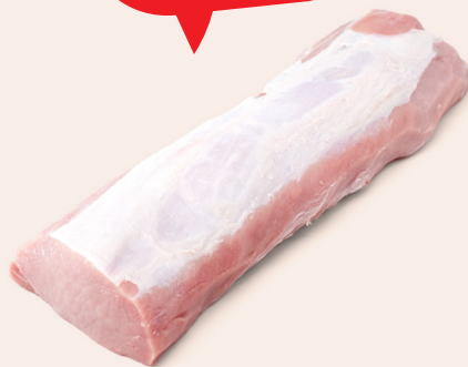
Duroc Nierstück ca. 2,5kg