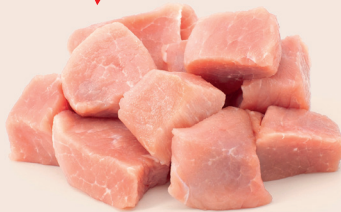
Voressen Schwein geschnitten, ca. 300g