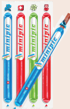
Minipic Classic 90 g