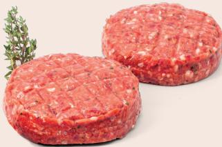
Pur-Duroc Burger 2 x 125 g